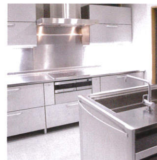
キッチン周りのべた付きに

ご家庭の住居汚れはもちろん、トイレやバス周り、洗面台等の汚れにもご使用ください。