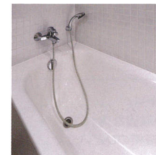
浴室の湯垢黒ずみに