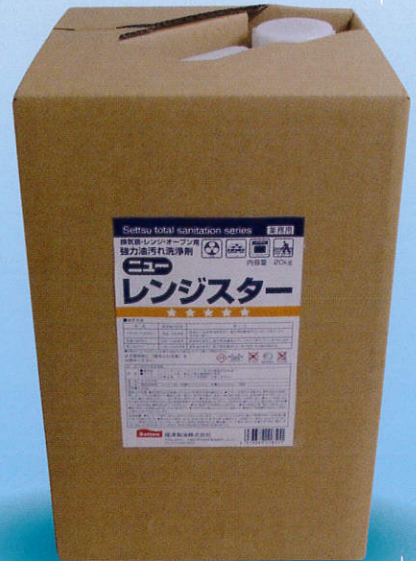
ニューレンジスター 20kgタフテナー