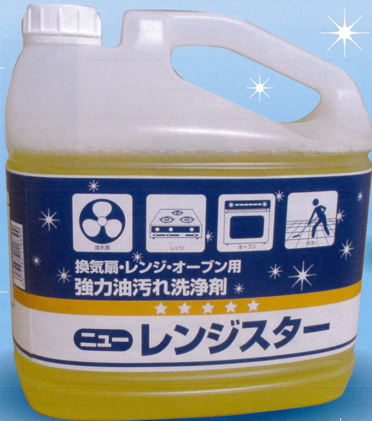
ニューレンジスター 5kg